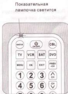
Показательная лампочка светится

4. Рабочая показательная лампочка светится, при этом переходят в режим автоматического поиска