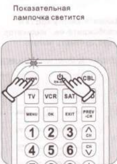
Показательная лампочка светится

3. Сначала нажимают кнопку «Настройки», не отжимают, потом нажимают кнопку «Источника электропитания» до тех пор, пока светится рабочая показательная лампочка, потом отжимают.